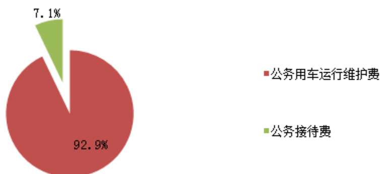
中国人民银行延边州分行 2024 年度“三公”经费支出构成

2024 年度“三公”经费决算数 15.73 万元，公务用车运行维护费 14.61 万元，占 92.9%；公务接待费 1.12 万元，占 7.1%。具体情况如下：